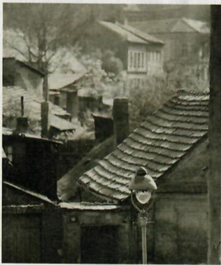
Zátory ve starých Holešovicích nedlouho před demolicí

si s ním chtěli o něčem důležitém promluvit. Ukázalo se, že jde o příslušníky Státní bezpečnosti, a z rozhovoru vyplynulo předvolání k výslechu na ministerstvo vnitra, kde ho marně přesvědčovali ke spolupráci.