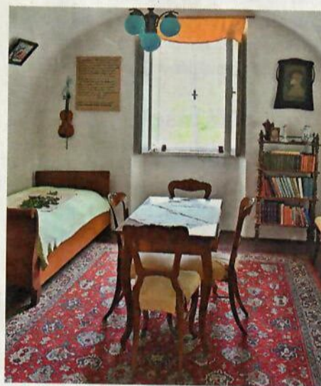
Pamětní síň Václava Beneše Třebízského na faře v Klecanech →